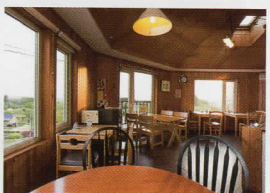
▲雄大な景色が眺められる店内では自然栽培の美味しい野菜も販売

自家焙煎のコーヒーは水にもこだわり、麦飯石でろ過したミネラル水を使用している。何度食べても飽きのこないスイーツも自家製。☎0123-88-0820 函長沼町加賀団体 圖11:00~日没頃(17:00までは必ず営業) 図⑧(⑧の場合は営業)、年末年始 圖44 図15台