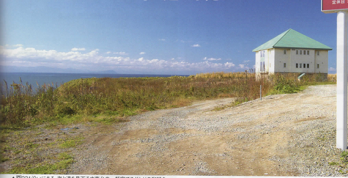
▲図231沿いにある、海と港を見下ろす高台の一軒家でこだわりの珈琲を